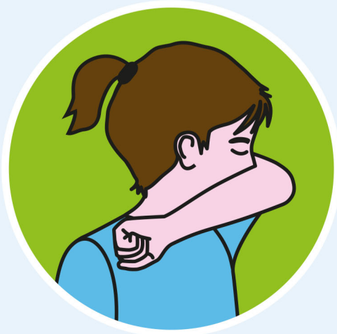
IN DIE ARMBEUGE