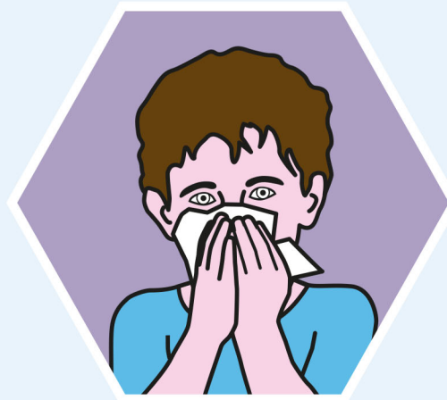
IN EIN PAPIERTASCHENTUCH