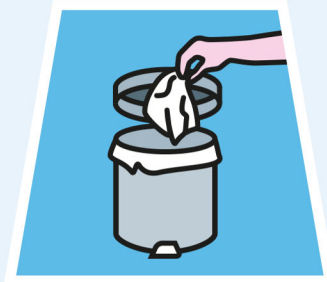
IN DEN MÜLLEIMER WERFEN