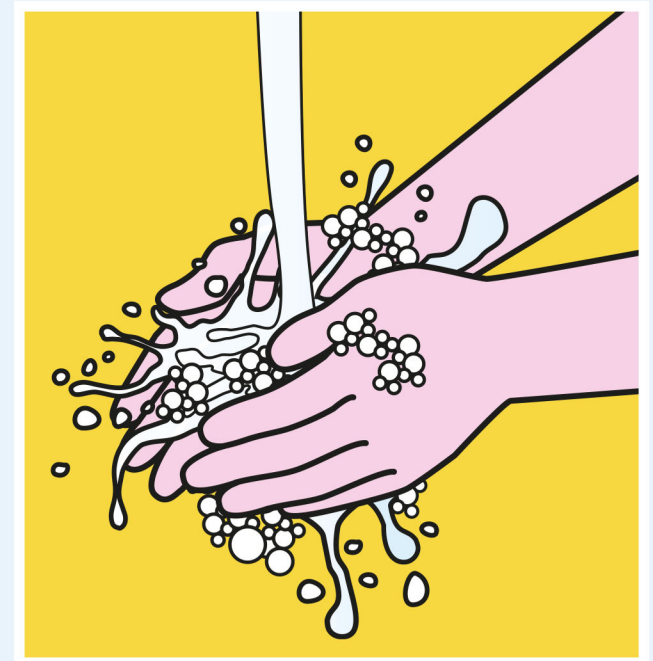
HÄNDEWASCHEN NICHT VERGESSEN